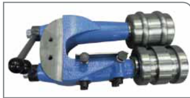
Unidad estándar de corrugado

Produce conductos con una superficie interior lisa en los extremos, pero reforzada con corrugado