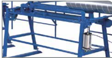
Mesa de salida estándar

Aumenta la capacidad de producción hasta un 30 %