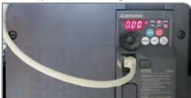
Configuración del accionamiento

Aplicaciones de conductos especiales para la industria de la construcción