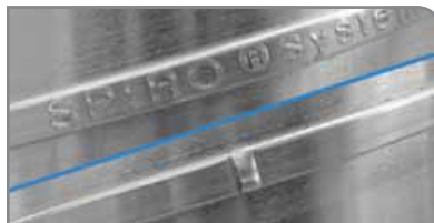
Grabado individual/Juntura de bloqueo fija

Diferentes configuraciones para potenciar las capacidades de producción