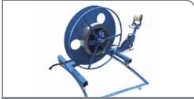
Vertical Desbobinador DCV-1000

Desbobinador estándar con capacidad de carga de máx. 1000 kg