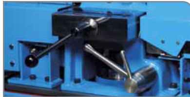
Sistema de cierre rápido

Corte superior/mínimo mantenimiento/fácil configuración