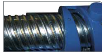
Aplicación tensionado posterior

Refuerce sus conductos con dimensiones >250 mm