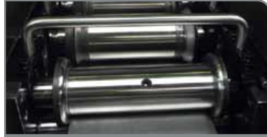
Sistema de cassette

Desbobinador estándar con capacidad de carga de máx. 1000 kg