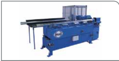
Spiro ® Speed Carrier (SSC)

Aumenta la capacidad de producción hasta un 30 %