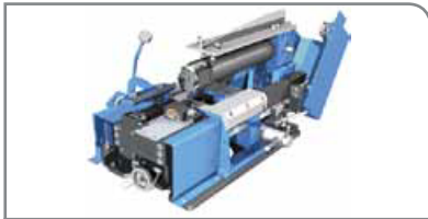
Slitter Modelo H

Unidad estándar con cilindros de acero de la máxima calidad