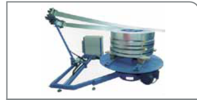
Horizontal Desbobinador DCH-3000

longitud del conducto de hasta 3 m, incluye descarga automática