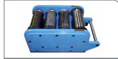
Unidad de cilindro de moldeo

Unidad estándar con cilindros de acero de la máxima calidad