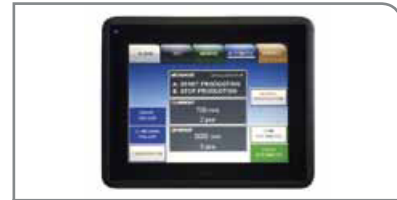
Interfaz de usuario vanguardista

Cambio rápido opcional de los cabezales de moldeo